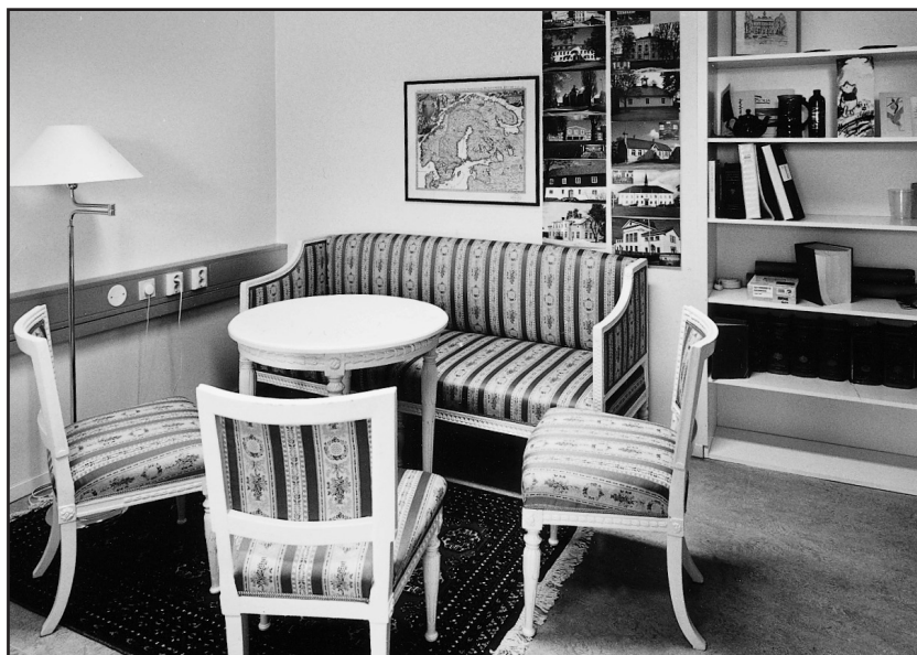
Gustaviansk soffgrupp. Donation ca 1890.