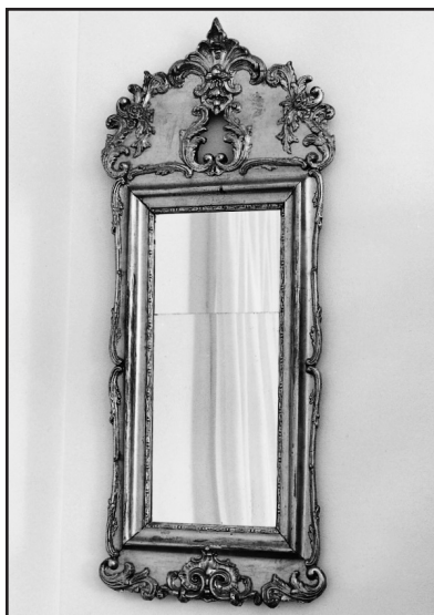
Antik spegel. Donation