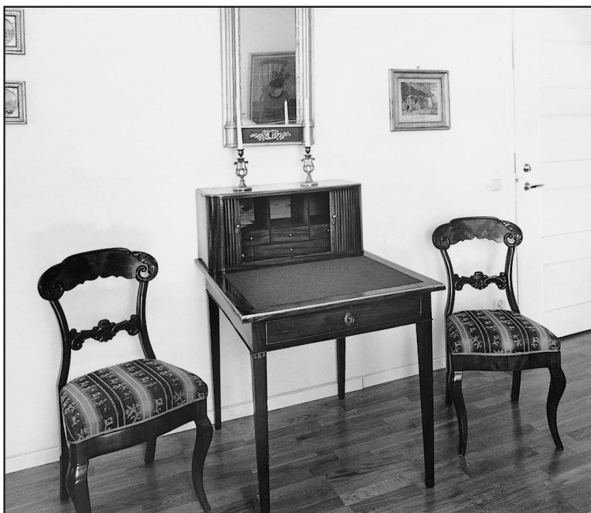
Antikt skrivbord med stolar och 2 ljusstakar + spegel. Donerade till sjukhemmet ca 1890.

Stiftelsens inventarier är deponerade i Domstolarnas hus vid Hamntorget. De kanske värdefullaste enskilda föremålen – ett antikt damskrivbord med bordsur med glaskupol - pryder lagmannens rum. I samband med upprättade av denna historik har samtliga stiftelsen tillhöriga lösören fotograferats och dokumenterats.