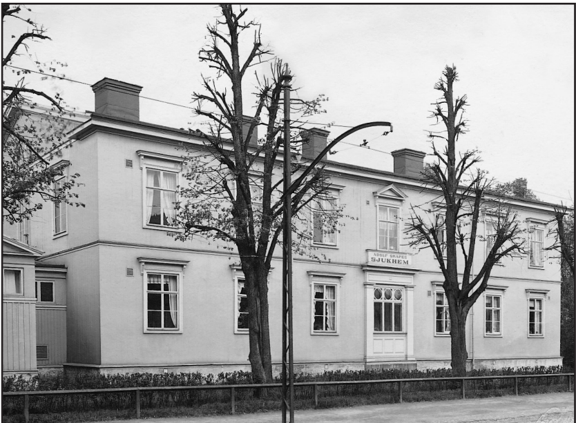
Adolf Grapes sjukhem. Foto ca 1920.