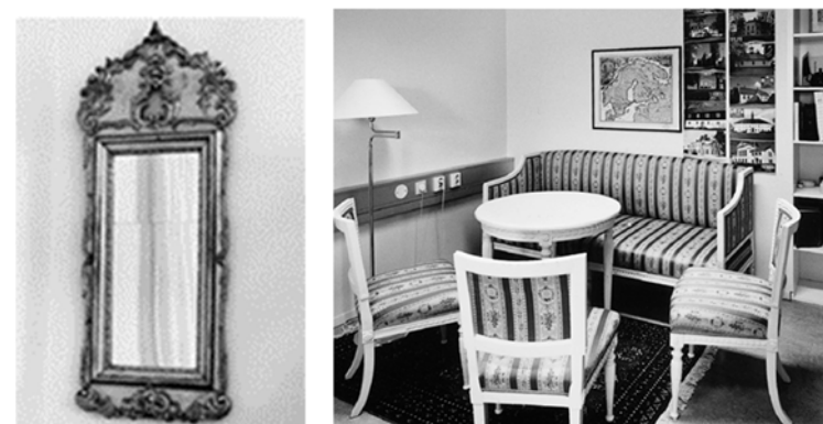
På bild: inventarier som fortfarande hör till stiftelsen. Sedan 2010 deponerade på Gävle Stadshus.