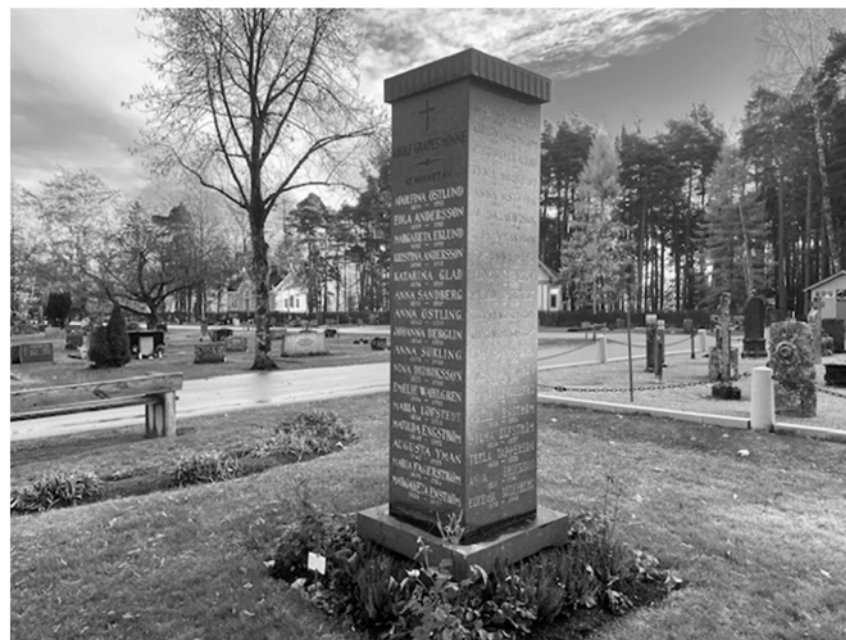
I en patientförteckning, förvarad på Arkiv Gävleborg, återfinns fröken Emma H (1851–1932) som bodde nästan halva sitt liv på sjukhemmet. Enligt ordningsreglerna gick det ingen nöd på henne. Förutom fyra måltider fick hon ta emot "välvilliga gåfvor af s.k. förfriskningar". Avgiften var låg och betalades till stor del av fattigvården.

På Gamla kyrkogården reser sig en hög gravsten med 45 kvinnonamn. De har alla bott på sjukhemmet.