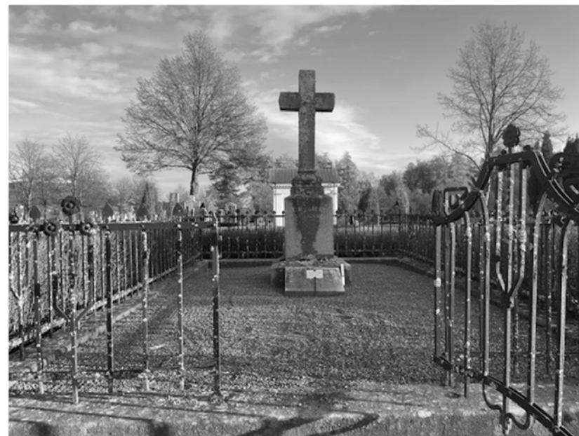
Grapes familjegrav på Gamla kyrkogården i Gävle.

På Gamla kyrkogården i Gävle vilar han i familjegraven.